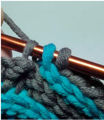
hier: Ende erste HR mit Aufnahme der LM-Schlinge und erster ausgelassener Masche