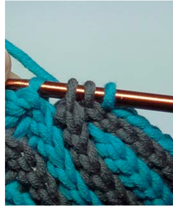
hier: Ende folg. HR mit Aufnahme der LM-Schlinge und erster ausgelassener Masche