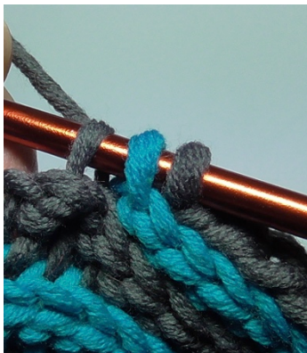
hier: Ende erste HR mit Aufnahme der LM-Schlinge und erster ausgelassener Masche

Die verkürzten Reihen werden wieder verlängert und zwar immer um 2M, dafür werden am Ende einer Hinreihe die ausgelassenen Maschen der vorletzten Rippe (gleiche Farbe) gehäkelt. Damit keine Lücken entstehen, wird bevor in die Masche der vorletzten Rippe gestochen wird, die Wendeluftmasche(n) der vorherigen Rippe(n) mit auf die Nadel genommen. Der Faden wird dann durch alle 3(4) Schlingen gezogen (s. Bilder u./od. die Video-Anleitung an, dann ist es verständlicher)